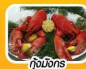
กุ้งมังกร