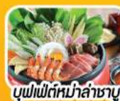
บุฟเฟ่ต์หม่าล่าชาบู

บุฟเฟ่ต์ หม่าล่า อาหารจีนจักรพรรดิ ข้าวมันไก่เจียอี้ บุฟเฟ่ต์ XIN TIAN DI อาหารจีน Seafood กุ้งมังกร