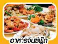
อาหารจีนซีฟู้ด