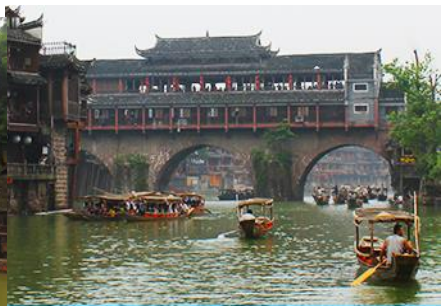
ล่องเรือแม่น้ำถั่วเจียง

พักที่ FENGHUANG GUOBIN HOTEL หรือ เทียบ 4 ดาว