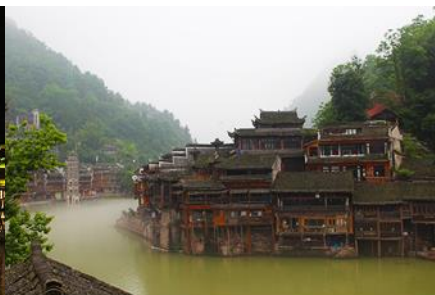
เมืองโบราณเฟิงหวาง