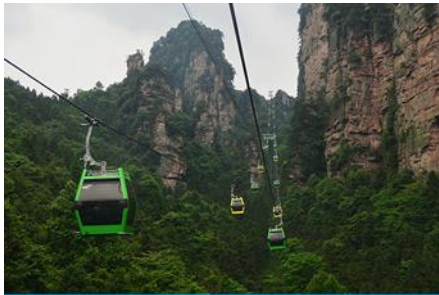
นั่งกระเช้าพิษียอดเขาเทียนเหมินซาน

⊗ นำท่านขึ้น พิษียอดเขาเทียนเหมินซาน โดยสารกระเช้าที่ยาวที่สุดในโลก (กระเช้ามีความยาวถึง 7.5 กิโลเมตร) อยู่สูงเหนือระดับน้ำทะเล 1,518 เมตร ขณะที่นั่งกระเช้าขึ้นเขาสามารถชื่นชมทัศนียภาพที่สวยงามของภูเขาที่มีความอลังการแห่งนี้ สามารถมองเห็นประตูสวรรค์ซึ่งเป็นโพรงหินขนาดใหญ่บนยอดเขา มองเห็นความคดเคี้ยวของ เส้นทาง 99 โค้ง และภูเขาสูงใหญ่มากมายที่ตั้งตระหง่านเสียดฟ้า เมื่อถึงยอดเขาเทียนเหมินซาน นำคณะเดินตามเส้นทางชมวิวเลียบภูเขาและหน้าผาชมทัศนียภาพจากมุมสูงบนยอดเขา อีกทั้งได้สัมผัสการเดินบนพื้นกระจกใสของ ทางเดินกระจกเลียบหน้าผา เพื่อวัดความใจกล้าของท่าน สำหรับนักท่องเที่ยวที่ไม่ต้องการเผชิญกับความหวาดเสียวสามารถนั่งรถบริเวณทางออกอีกด้านของ ทางเดินกระจกเลียบหน้าผา..... จากนั้นนำท่านสู่ ประตูสวรรค์ โพรงหินทะลุภูเขาขนาดใหญ่ ซึ่งในปี 1990 มีนักบินชาวรัสเซียขับเครื่องบิน 3 ลำบินลอดผ่านช่องโพรงหินประตูสวรรค์แห่งนี้พร้อมกัน ภาพประวัติศาสตร์นี้ถูกบันทึกและเผยแพร่ไปทั่วโลก ภูเขาเทียนเหมินซานจึงเป็นที่รู้จักของนักผจญภัยทั่วโลกที่อยากเดินทางมาสัมผัสด้วยตัวเอง