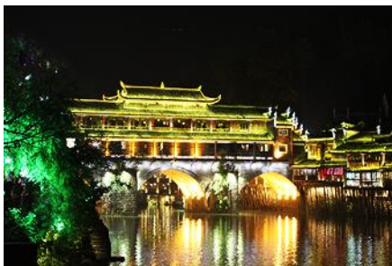
เมืองโบราณเฟิงหวาง

นำท่านเที่ยวชมเมืองฟงหวางยามค่ำคืน ชมเมืองโบราณฟงหวาง ที่เต็มไปด้วยแสงสีแบบตื่นตาตื่นใจ ชมผ้าไหมที่ปักด้วยไหมน้ำถั่วเจียง ตกแต่งแบบแนวแนวสุดฤทธิ์สุดเดช ชมและเลือกซื้อสินค้า HANDMADE เสื้อยืด, รองเท้าเก๋ๆ เขียนสีลงลายสดใส แบบนั่งวาดกันให้เห็น และของพื้นเมืองต่างๆอีกมากมาย สถานที่บันเทิงจะปิดประมาณ ติหนึ่ง ร้านค้าเริ่มทยอยปิดประมาณ 5 ทุ่ม ในย่านเมืองโบราณฟงหวาง