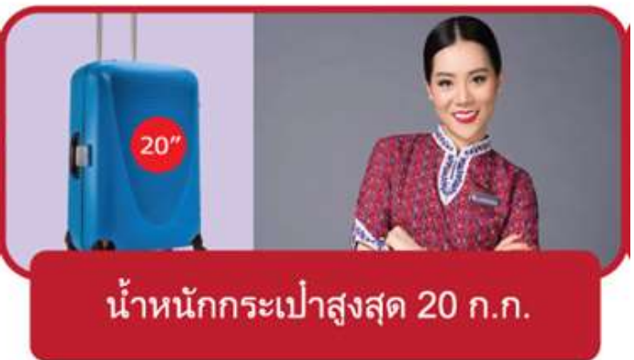
น้ำหนักกระเป๋าสูงสุด 20 กก.

*** ในการเดินทางเป็นหมู่คณะ การจัดที่นั่งของกรุ๊ป ไม่สามารถรีเคอร์หรือเลือกที่นั่งได้ และทางสายการบินเป็นผู้กำหนด ซึ่งทางบริษัทฯ ไม่สามารถเข้าไปแทรกแซงได้ ***