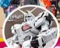
โอโดบะโดเวอร์ซี้