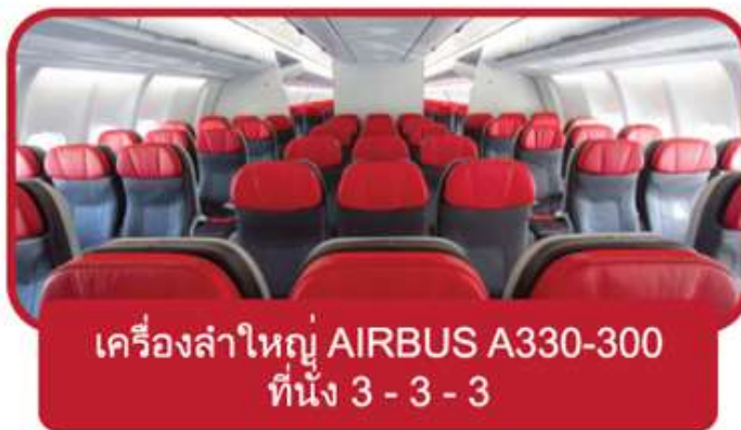
เครื่องบินใหญ่ AIRBUS A330-300 ที่นั่ง 3 - 3 - 3

** ไม่มีบริการอาหารและเครื่องดื่มบนเครื่องบิน แต่มีจำหน่าย ใช้น้ำเวลาบินโดยประมาณ 6 ชั่วโมง **