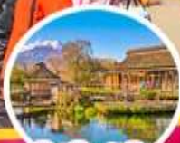
โอชิโนะอากิ