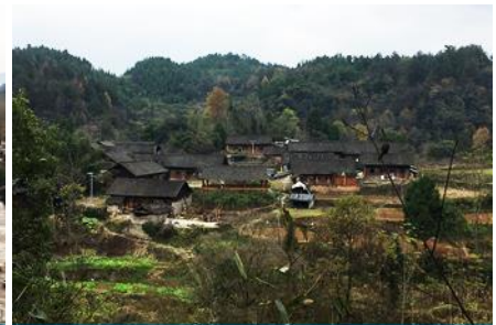
เมืองงวเหริน

วันแรก กรุงเทพฯ(ท่าอากาศยานสุวรรณภูมิ) – พิพิธภัณฑ์ภาพหินทราย – เมืองงวเหริน – เมืองโบราณต้าหมิง