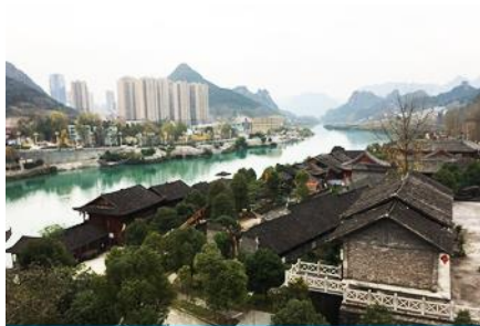
เมืองงวเหริน