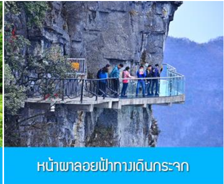
หน้าผาลอยฟ้าทางเดินกระจก

วันที่ห้า เมืองจางเจียเจี๋ย – เทียนเหมินซาน (กระเช้าขึ้นลง) – ทางเดินกระจกเลียบน้ำผา – กรุงเทพฯ(ท่าอากาศยานสุวรรณภูมิ)