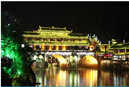
เมืองโบราณฟ่งหวง

พักที่ TONGREN WANSHANHONG HOTEL ระดับ 5 ดาวท้องถิ่นหรือเทียบเท่าใน เมืองลงเหริน