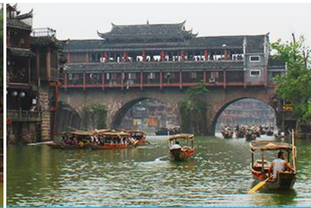
ล่องเรือแม่น้ำถั่วเจียง

วันที่สอง เมืองลงเหริน – หมู่บ้านชนเผ่าแม้ว – เมืองโบราณฟ่งหวง – ล่องเรือแม่น้ำถั่วเจียง – ชมเมืองโบราณฟ่งหวง