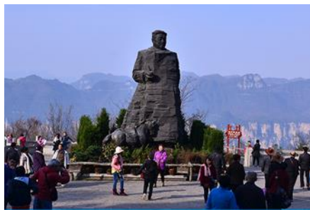
สวนจอมพลอ๋อหลาง