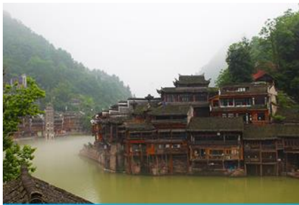
เมืองโบราณฟ่งหวง