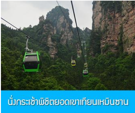
นั่งกระเช้าพิชิตยอดเขาเทียนเหมินซาน