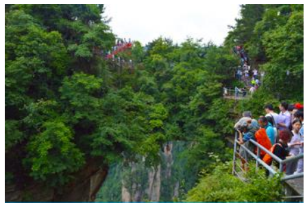
สะพานหนึ่งใบไม้ได้หล่า