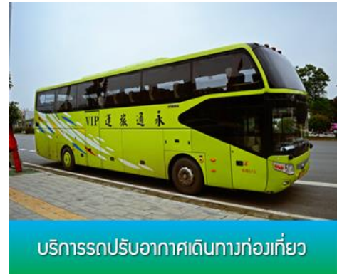
บริการรถปรับอากาศเดินทางท่องเที่ยว

10.35 น. เดินทางถึง สนามบิน เมืองจางเจี๋ยเจี๋ย ผ่านพิธีการตรวจคนเข้าเมืองและศุลกากร... จางเจี๋ยเจี๋ย เป็นอุทยานมรดกโลกตั้งอยู่ทางตะวันตกเฉียงเหนือของมณฑลหูหนาน เป็นอุทยานแห่งชาติแห่งแรกของจีน และได้รับการประกาศให้เป็นมรดกโลกธรรมชาติในปี ค.ศ.1992 อุทยานจางเจี๋ยเจี๋ยมีเนื้อที่กว่า 369 ตารางกิโลเมตร อุดมด้วยขุนเขาน้อยใหญ่และต้นไม้ขนาดใหญ่