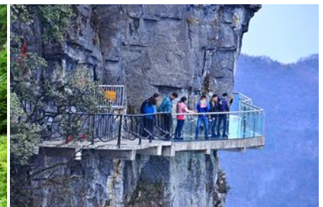
หน้าผาลอยฟ้าทางเดินกระจก

** บันไดเลื่อนทะลุภูเขาและถนน 99 โค้งจะปิดให้บริการในช่วงเดือนธันวาคม - เดือนกุมภาพันธ์ ของทุกปีทาง ด้วยเหตุผลด้านความปลอดภัย เนื่องจากเป็นช่วงที่มีหิมะปกคลุมในจุด และเส้นทาง