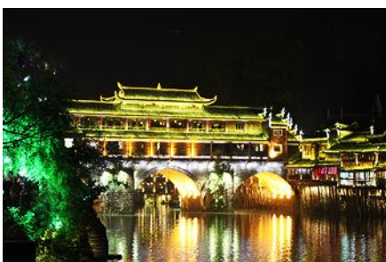
เมืองโบราณเฟิงหวาง

☀ ชมเมืองโบราณเฟิงหวาง เฟิงหวางมีโบราณสถานและโบราณ วัตถุทางด้านวัฒนธรรมอันล้ำค่าที่ตกทอดมาจากราชวงศ์หมิงและชิง มีถนนที่ปูด้วยหินสีขาว 20 กว่าสาย มีกำแพงเมืองโบราณ "เฟิงหวางกุเจี๋ย" ซึ่งสร้างขึ้นในสมัยราชวงศ์หมิง ☀ ชมหงเจี๋ยว สะพานไม้โบราณที่มีหลังคาคลุมเหมือนสะพานข้ามคลองในเวนิส จุดเด่นอีกแห่งหนึ่งของเฟิงหวาง คือบ้านที่ยกพื้นสูงเรียงรายกันบนริมน้ำที่ใสสะอาดจนเห็นกันบึงเป็นทัศนียภาพที่สวยงามและเป็นที่ยอมรับชื่นชอบทั้งชาวจีนและชาวต่างประเทศ ☀ นำท่านนั่งเรือแจว ชมบ้านเรือนริมน้ำและชมเจดีย์ว่านหมิง