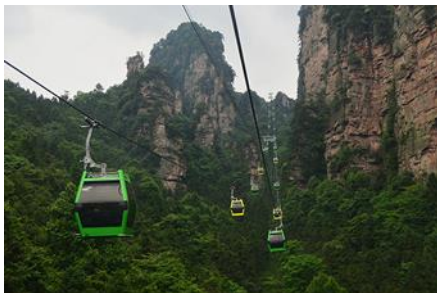
นั่งกระเช้าพิชิตยอดเขาเทียนเหมินซาน

**หมายเหตุ : ในฤดูท่องเที่ยวที่มีจำนวนนักท่องเที่ยวต่อแถวขึ้นกระเช้าเป็นจำนวนมาก ทางบริษัทฯ อาจทำการสลับโปรแกรมให้คณะนั่งรถอุทยานขึ้นไปยังบริเวณถ้ำประตูสวรรค์ จากนั้นนำคณะขึ้นยอดเขาผ่านบันไดเลื่อนทะลุภูเขา เมื่อเสร็จจากการเที่ยวชมบนยอดเขาแล้วจึงนำคณะลงจากยอดเขาโดยกระเช้าลอยฟ้า ซึ่งเป็นการสลับการใช้ยานพาหนะในการขึ้น/ลงเขา เพื่อหลีกเลี่ยงการรอคิวนานเกินไปในช่วงเทศกาล*****