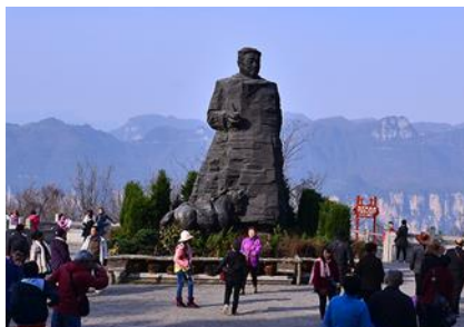
สวนจอมพลอ้อหลง