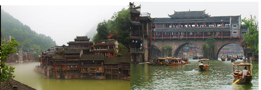
เมืองโบราณเฟิงหวาง