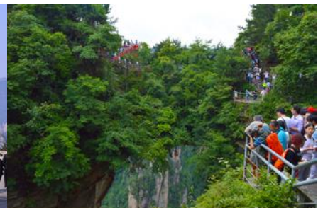
สะพานหนึ่งในใต้หล้า

พักที่ JING XI INTERNATIONAL HOTEL หรือเทียบเท่า 4 ดาว