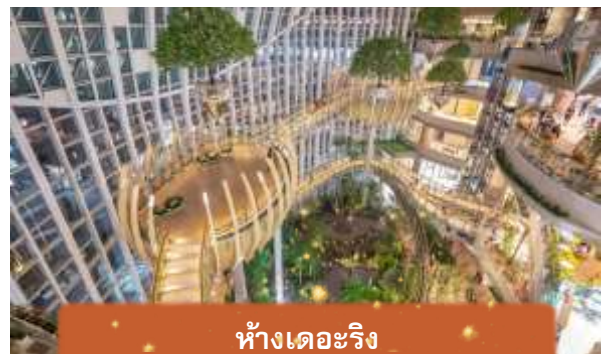
ห้างเดอะริง

คำ อิสระอาหารค่ำเพื่อความสะดวกในการท่องเที่ยว