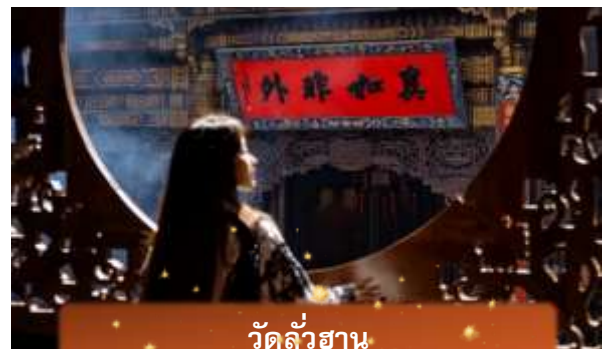
วัดลั่วฮาน