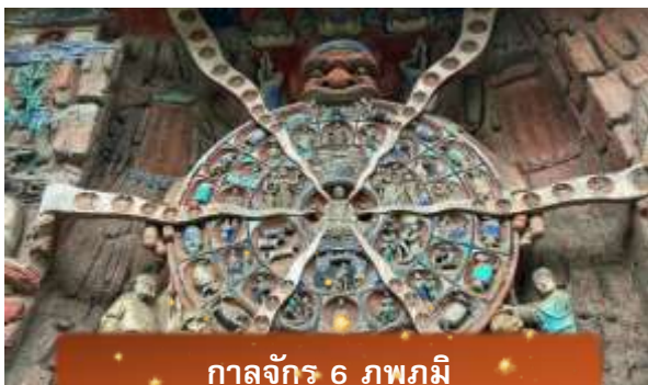
กาลจักร 6 ภพภูมิ

หลังจากนั้นนำท่านเดินทางกลับ เมืองฉงชิ่ง