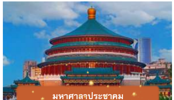
มหาศาลาประชาชน