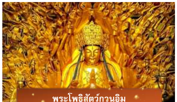
พระโพธิสัตว์กวนอิม

นำท่านเดินทางสู่ มรดกโลกอุทยานผาหินแกะสลักต้าจู่ ศิลปะหินแกะสลักอันล้ำค่าแห่งเมืองฉงชิ่งมรดกโลกที่องค์การยูเนสโกขึ้นทะเบียนเมื่อปี ค.ศ. 1999 ตั้งอยู่ทางตะวันตกของนครฉงชิ่ง ประเทศจีน ศิลปะหินแกะสลักเหล่านี้สร้างขึ้นตั้งแต่ราชวงศ์ถังจนถึงราชวงศ์ซ่ง มีอายุมากกว่า 1,000 ปี โดดเด่นด้วยงานแกะสลักทางพุทธศาสนาที่งดงามและยังคงสภาพสมบูรณ์ (ใช้เวลาเดินทางประมาณ 1-2 ชั่วโมง)