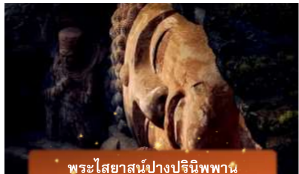
พระไสยาสน์ปางปรินิพพาน