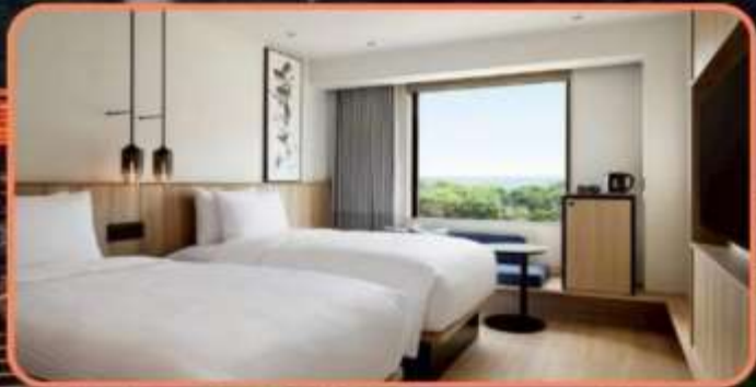
WESTERN STYLE STANDARD TWIN ROOM 25 SQM.