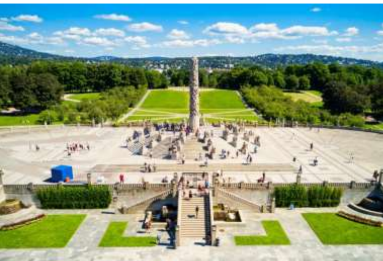
สวนประติมากรรมวิกเกอลันด์ (Vigeland Sculpture Park)

นำท่านเดินทางสู่ จุดชมวิวลานกระโดดสกีโฮเมนคอเลน (Holmenkollen Ski Jump) หนึ่งในสถานที่สำคัญของกรุงออสโล ซึ่งสร้างขึ้นเพื่อรองรับการแข่งขันกระโดดสกีระดับนานาชาติ และถือเป็นสัญลักษณ์ด้านกีฬาฤดูหนาวของประเทศนอร์เวย์ จากบริเวณลานกระโดดนี้ ท่านสามารถชมทัศนียภาพอันงดงามของกรุงออสโลและอ่าวออสโลฟยอร์ดได้อย่างชัดเจน นำท่านเดินทางสู่ อุทยานฟรอกเนอร์ (Frogner Park) สวนสาธารณะขนาดใหญ่ใจกลางกรุงออสโล จากนั้นนำท่าน เข้าชม สวนประติมากรรมวิกเกอลันด์ (Vigeland Sculpture Park) ถือเป็นสวนประติมากรรมกลางแจ้งที่ใหญ่ที่สุดในโลก ผลงานศิลปะกลางแจ้งอันยิ่งใหญ่ของ กุสตาฟ วิกเกอลันด์ (Gustav Vigeland) ปฏิมากรเอกชาวนอร์เวย์ ผู้ใช้เวลากว่า 40 ปีในการสร้างสรรค์ผลงานอันทรงคุณค่าท่านจะได้ชมประติมากรรมที่สื่อถึง “วัฏจักรชีวิตมนุษย์” ตั้งแต่วัยเยาว์จนถึงชรา ถ่ายทอดผ่านงานแกะสลักหินแกรนิตและรูปหล่อทองแดงจำนวนกว่า 200 ชิ้น กระจายอยู่ทั่วบริเวณสวนจุดเด่นของอุทยานคือ ประติมากรรม “โมนอลิธ” (Monolith) เสาหินแกรนิตขนาดมหึมาสูง 17 เมตร ที่แกะสลักลวดลายร่างมนุษย์จำนวนมากขึ้นสู่ยอดเสา อันเป็นสัญลักษณ์ของความเชื่อมโยงและการเติบโตของชีวิตมนุษย์