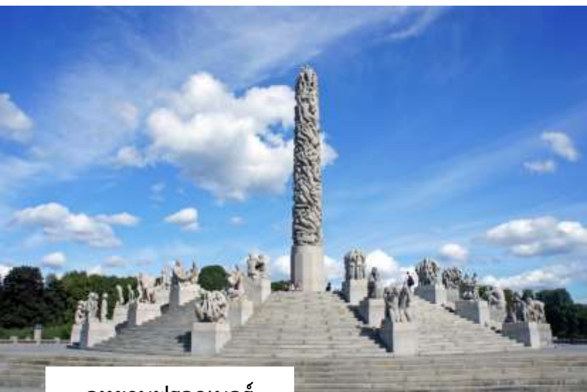
อุทยานฟรอกเนอร์ (Frogner Park)