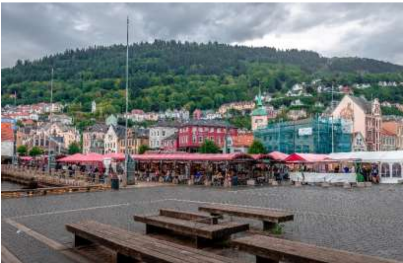
ตลาดปลา (Fish Market)

จากนั้นนำทุกท่านเที่ยวชมเมือง เบอร์เกน (Bergen) หนึ่งในเมืองมรดกโลกที่ได้รับการอนุรักษ์ไว้อย่างงดงาม สะท้อนกลิ่นอายแห่งประวัติศาสตร์ควบคู่กับเสน่ห์ของธรรมชาติ ให้ทุกท่านได้เพลิดเพลินกับการเดินชมตลาดปลา (Fish Market) แหล่งรวมปลาทะเลน้ำลึกหลากชนิด ผักผลไม้สดตามฤดูกาล และอาหารท้องถิ่น ให้ท่านได้เลือกชม เลือกชิม และสัมผัสบรรยากาศวิถีชีวิตของชาวเมืองอย่างใกล้ชิด ตลาดปลามีประวัติความเป็นมายาวนาน และยังคงเป็นศูนย์กลางการค้าทาง ทะเลและจุดเชื่อมต่อด้านการท่องเที่ยวที่สำคัญของภูมิภาคแห่งนี้