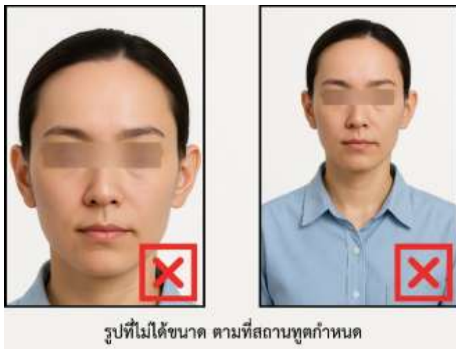
รูปที่ไม่ได้ขนาด ตามที่สถานทูตกำหนด

❌ ห้ามสวมใส่ต่างหู สร้อยคอ หรือ เครื่องประดับใด ๆ ที่อยู่บริเวณใบหน้า และ ลำคอ