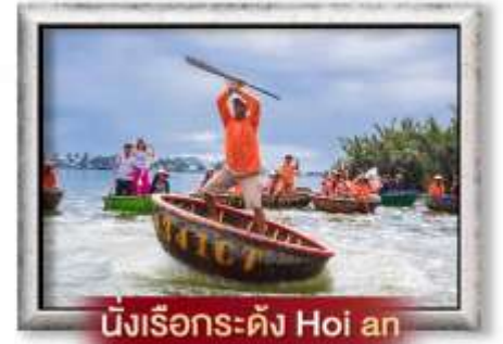
นั่งเรือกระดิง Hoi an