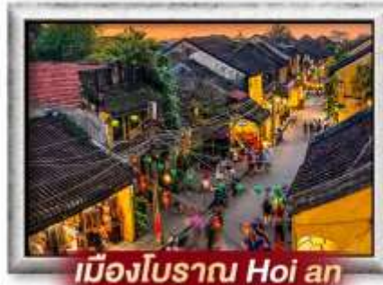
เมืองโบราณ Hoi an